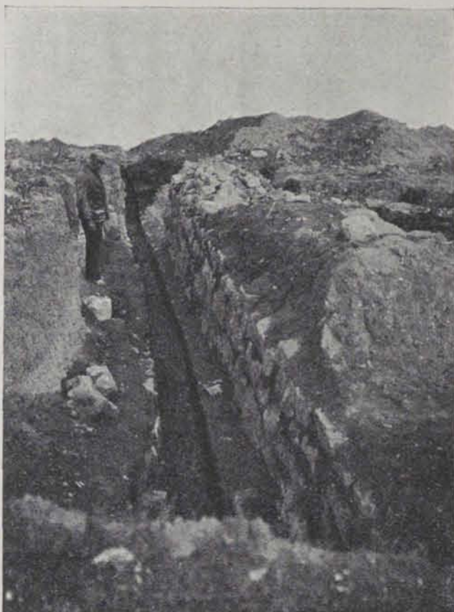
Fig. 149. — Muralla d'E. a O. que divideix l'actual recinte romà

el sol les senyals de pas de les rodes dels carros a una amplada d'1'10 metres. Era en la perllongació del Kardo maximus romà, empedrat i porticat, almenys en son començament, junt a la porta (4) que dóna a mig-jorn. L'aparell és de menors dimensions, treballat en faixes junt a les arestes que enquadren un rectangle dels paraments en el qual la pedra resta sense treballar. Tal són les filades inferiors descobertes en el portal al començar els treballs (5). Sembla indubtable que aquest gran recinte rectangular fou construït abans de la invasió romana i en època no llunyana del segle III. El mètode de construcció és dintre el tipus del mur d'Olèrdola i del que, marcat amb lletres ibèriques, es conserva a Tarragona (6).