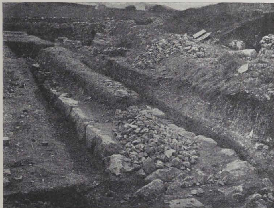
Fig. 150. — Muralla de N. a S. del recinte romà

En dies successius altre tros de muralla grega de 2'25 metres d'ample d'una llargada considerable ha estat descoberta més cap a l'Est comportant la disposició en cremallera.