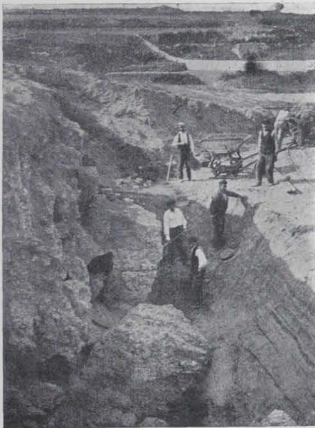
Fig. 148. — Excavacions en el port

Aquestes foren repeses en 1923. La campanya dona els seus resultats. Un d'ells fou la descoberta de la muralla que permeté completar en gran part el recinte rectangular superior on després s'establí la colònia romana i on és possible hi hagués la primitiva vila indígena que atragué els mercaders grecs. La descoberta es féu en els terrenys que per a les excavacions adquirí novament la Junta de Museus. Un gran mur d'un gruix de 2'65 metres, format en son exterior de pedres acarreuades, moltes d'un metre de llarg per 90 centímetres d'alçada, fou descobert en direcció perpendi-